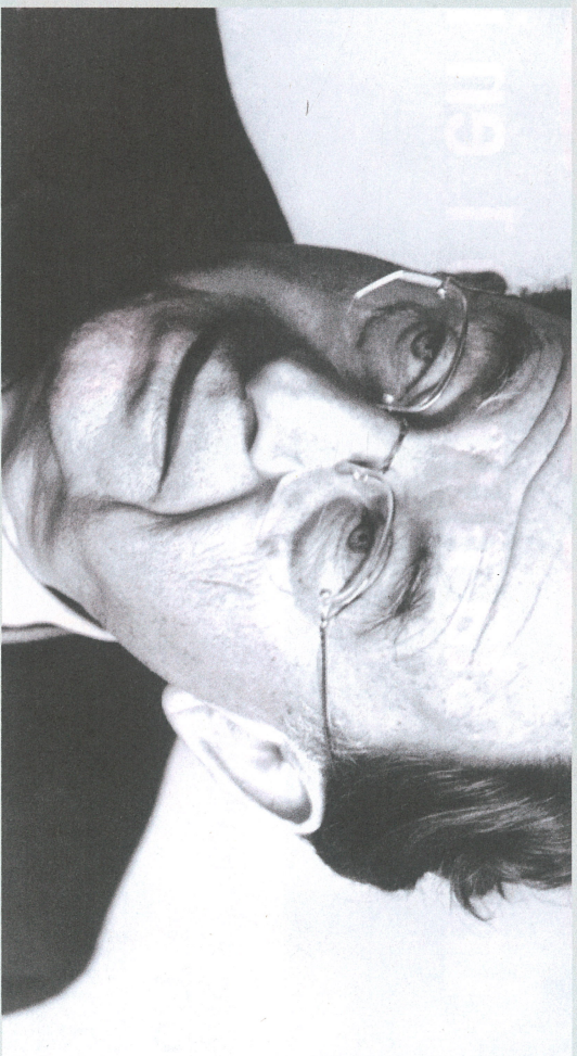
Erich Fromm apostó siempre por el libre pensamiento y el humanismo